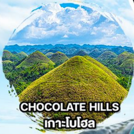
CHOCOLATE HILLS เกาะโมโฮ