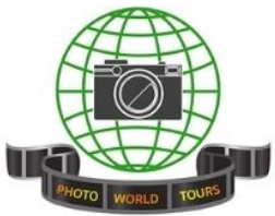
PHOTO WORLD TOURS