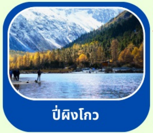
ป่ผิงโกว