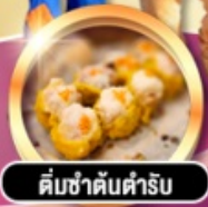
ต้มซ่าต้นตำรับ