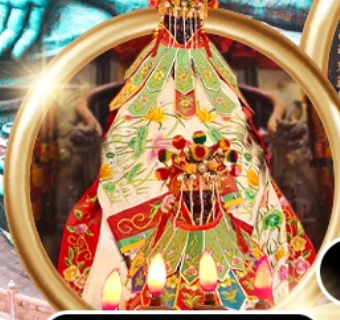
ยืมเงินเจ้าแม่กวนอิมสองห้า