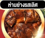
ห่านย่างสเสิส