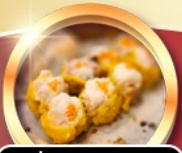
ต้มซ่าตันตำรับ