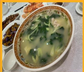
ซุปรังไก่หมู