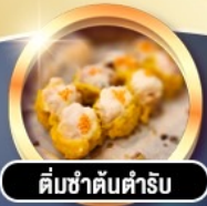
ติ่มซำคั่นตำรับ

การ์ดี!! พักอยู่ 4 ดาว THE KOWLOON HOTEL ติดถนนนาธาน ย่านช้อปปิ้งจิมซาจู้