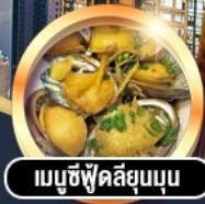
เมนูซีฟู้ดลิ้นยุมนุ่ม