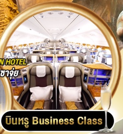
บินหรู Business Class