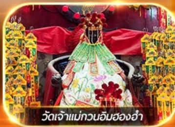
วัดเจ้าแม่ทวนอิมฮ่องกง