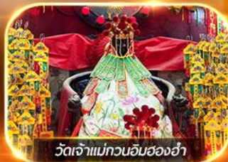
วัดเจ้าแม่กวนอิมสองห้า