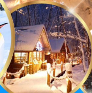
หมู่บ้านเทพนิยาย นิงเกิลทอเรส