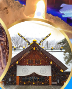
ศาลเจ้า ออกโทโต

เดินทาง 04 - 09 กุมภาพันธ์ 68 05 - 10 กุมภาพันธ์ 68 06 - 11 กุมภาพันธ์ 68