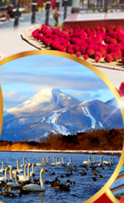
ทะเลสาบอินาวะชิโระ