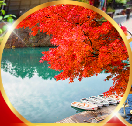
บึง 5 สี โทซึกิซุมะ