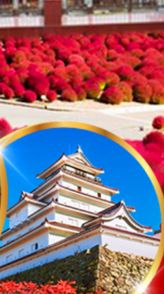
ปราสาทสิรุกะ