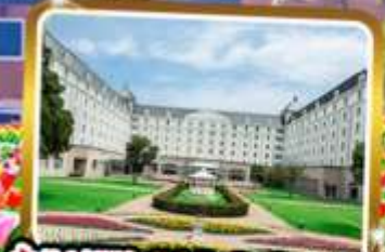
พัก Hotel Nikko Huis Ten Bosch ★★★★★