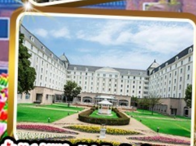
Win Hotel Nikko Huis Ten Bosch ★★★★★