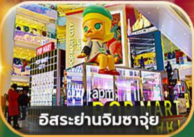
อิสระยานจิมซาจุ้ย