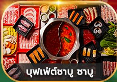
บุฟเฟ่ต์ซาบู ซาบู