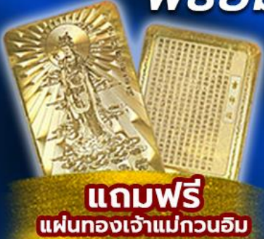
แถมฟรี แผ่นทองเจ้าแม่กวนอิม