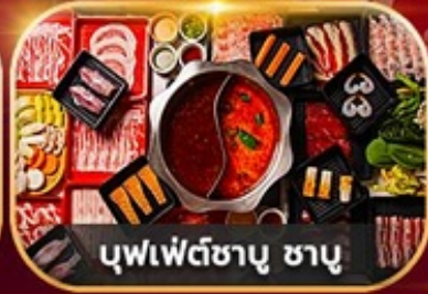
บุฟเฟ่ต์ซาซุ ซาซุ