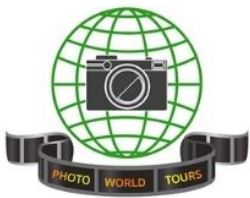
PHOTO WORLD TOURS