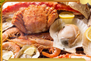
บั้งย่างร้านดังนั้นตะ