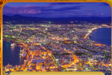
ชมวิวดาโกดาเตะ