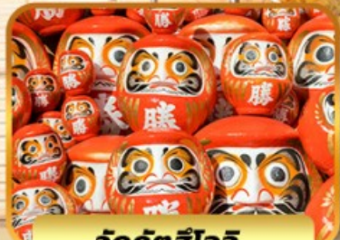
วัดคังสึโงจิ