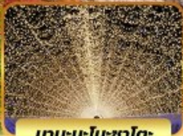
นาบะนะโนะซาโตะ