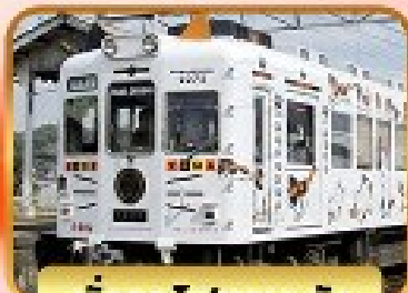
นั่งรถไฟทามะริง