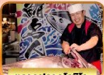
ตลาดปลาคุโรชิโอะ