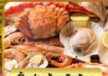
บิงย่างร้านดังเมืองโจซังเกะ