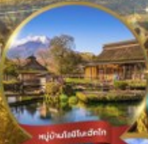
หมู่บ้านโงชิโนะฮักโก