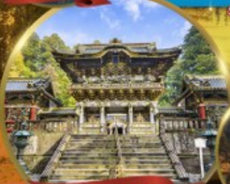
ศาลเจ้านิกโกโทโทกุ