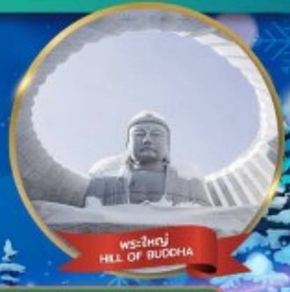
พระใหญ่ HILL OF BUDDHA

พักอาซาฮิคาว่า 1 คืน - โอดารุ 1 คืน - ซัปโปโร 2 คืน (ติดย่านช้อปปิ้ง)