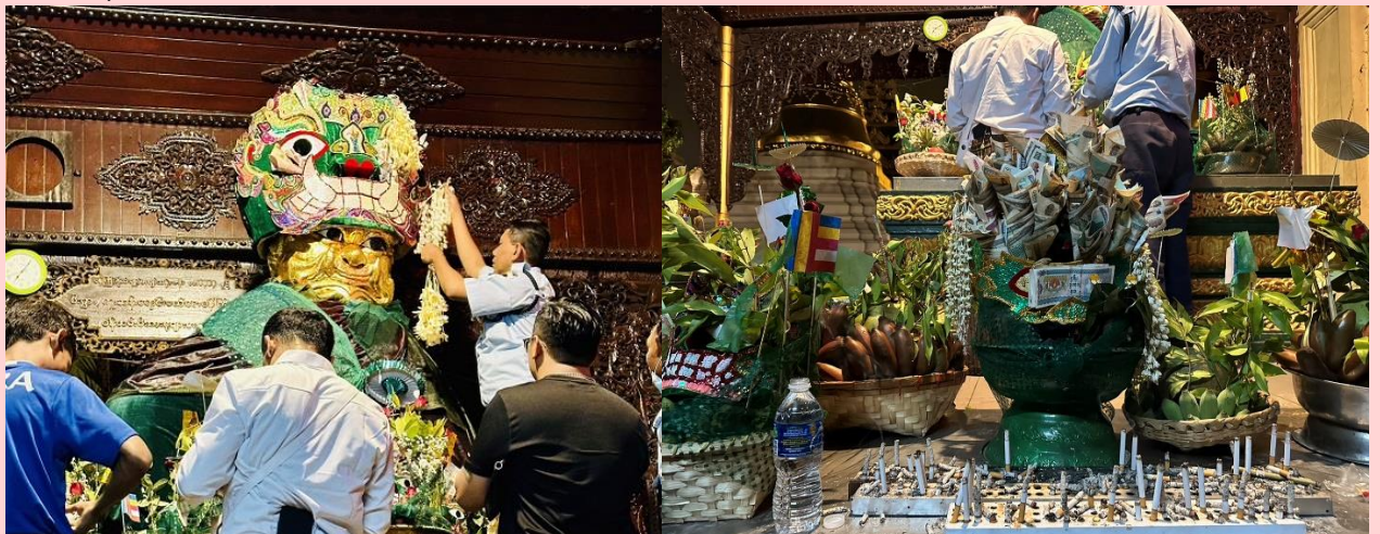
วิธีการขอพรจากแม่ยักษ์

พาท่านเดินไปขอพรที่ แม่ยักษ์ ผู้ปกป้องดูแลเจดีย์ คนพม่าเชื่อว่าแม่ยักษ์... จะช่วยในการตัดกรรมจากเจ้ากรรมนายเวร โดยเฉพาะอย่างยิ่งผู้ที่มีเวรกรรมกับเจ้ากรรมนายเวรทั้งหลายช่วยขจัดเคราะห์กรรม ขจัดอุปสรรค ติดขัดต่างๆ ความสำเร็จขอให้อาจารย์ช่วย ให้ชีวิตของคุณมีแต่ดีขึ้นเรื่อยๆ ซึ่งถ้าหากคุณกำลังมีทุกข์และหาหนทางไม่ออก ก็ลองมาไหว้ขอพรแม่ยักษ์ให้ช่วยบันดาลให้สิ่งร้ายๆ สิ่งไม่ดี ออกไปจากชีวิต และขอให้ชีวิตมีแต่สิ่งดีๆ เข้ามา นอกจากนี้ยังเชื่อกันว่าแม่ยักษ์... ยังช่วยเรื่องความมีชื่อเสียงโด่งดัง เป็นที่รู้จักก้าวหน้าในหน้าที่การงาน ใครที่ตกงานอยู่ จุดนี้เป็นอีกหนึ่งจุดที่ต้องห้ามพลาด ปล.แม่ยักษ์จะประดิษฐานอยู่ติดกับบันไดประตูทางทิศตะวันออกค่ะ