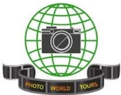
PHOTO WORLD TOURS