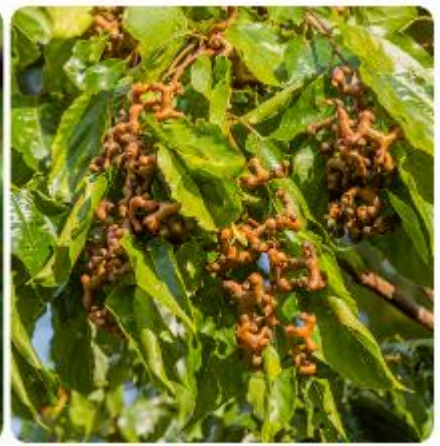
โบราณของชาวเกาหลีอีกด้วย