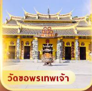
วัดขอพรเทพเจ้า