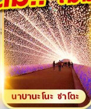
นาฮานะ โนะ ซาโตะ