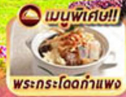
เมนูพิเศษ!! พระกระโดดกำแพง