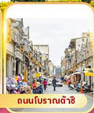
ถนนโบราณต้าชิ