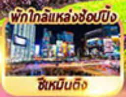
พักใกล้แหล่งช้อปปิ้ง ซีเหมินติง