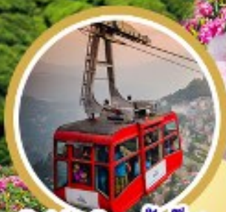
Cable Car ถึงตอก