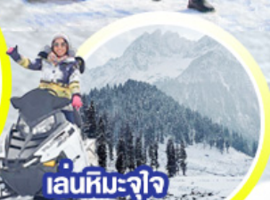
เล่นหิมะ-จาว ให้หายคิดถึง