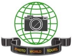
PHOTO WORLD TOURS