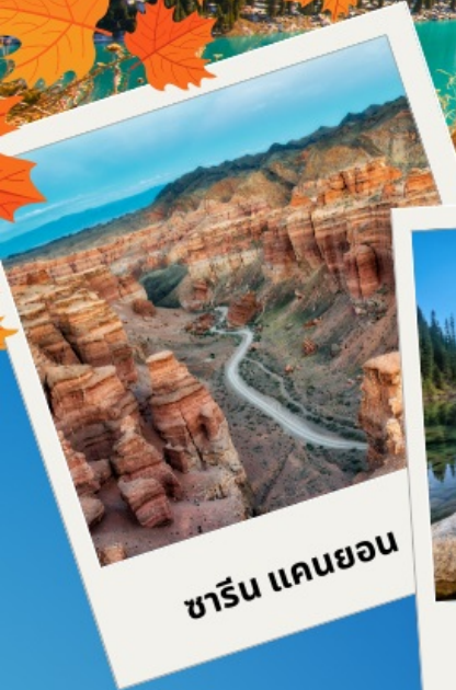
ชาริน แคนยอน