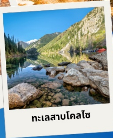
ทะเลสาบโคลไซ