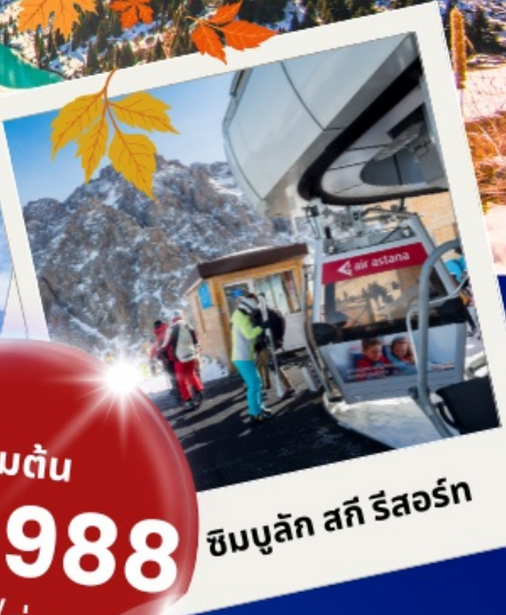
ซิมบูลัก สกี รีสอร์ท