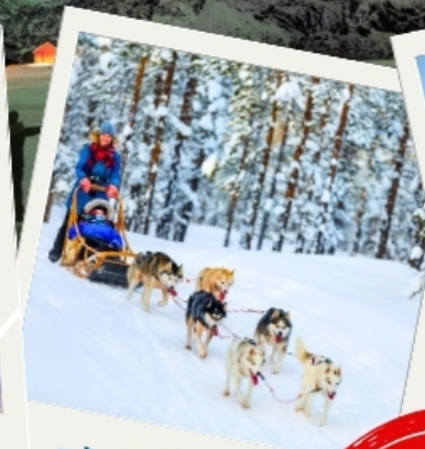
สุนัขฮัสกีลากเลื่อน