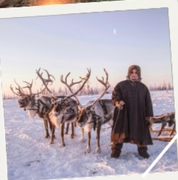
เมืองก็รอฟสค์