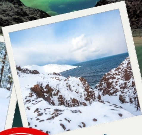
เทอริเบอก้า