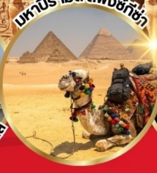
มหาปิรามิด สฟิงซ์กิซ่า