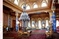
Beylerbeyi Palace ห้องเรือชองแคบบอสฟอรัส ตลาดสไปซ์มาร์เกต