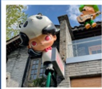
ถนนคนเดินซอยกว้างแคน