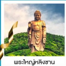
พระใหญ่หลิงซาน

วัดพระใหญ่หลิงซาน / ศาลาฟานกง / จตุรัสหยวนหลง / เมืองโบราณผานหลงกุจิ้น / Tian An 1,000 Trees Square / ตลาดดิ้งหวังเมี่ยว สวนสนุกเซี่ยงไฮ้ดิสนีย์แลนด์เต็มวัน / ถ่ายรูปหอไข่มุก / ลอดอุโมงค์เลเซอร์ / ถนนนานกิง / หาดไว่ทาน / STARBUCKS RESERVE ROASTERY