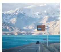
ทะเลสาบไ้ซาหู่