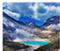
ทะเลสาบน้ำนม