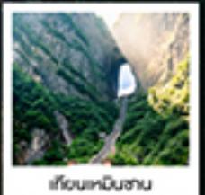
เขื่อนหนินชาน

กรุ๊ปทัวร์ / สพานกั๋วหย่า / เขื่อนหนินชาน / เมืองฝ่งหวง / ประตูสวรรค์ / ไร่หวงจิงจาง / เขื่อนหนินชาน สวนจอนหวง / ภาพวาดทราย / เมืองฟูหลงเจิน / ล่องเรือตามลำน้ำต๋อเจียง / เขื่อนโบราณฝ่งหวงยกน้ำท่วม