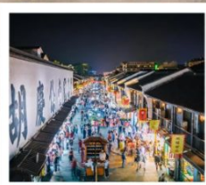
ถนนโบราณเหอฝ่งเจีย