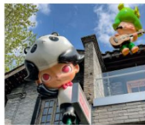
ถนนคนเดินชอยกว้างแคว