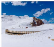
ต้ากู่ปิงชว่น