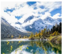
ปี้ผิงโกว