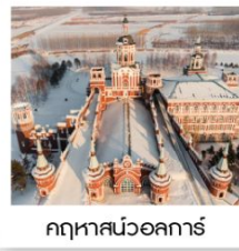
คฤหาสน์วอลการ์