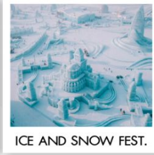
ICE AND SNOW FEST.

คฤหาสน์วอลการ์ (ฟรีเล่น Snow Tubing) โบสถ์เซนต์นิโคลัส / มู่ตันเจียง / ชมแสงสีกลางคืนถนนเส่ยุนเจีย เขาเกะหลัว / เขาปังดุย / ภาพเขียนสี ICE AND SNOW โบสถ์เซินโซเฟีย / เกาะพระอาทิตย์ / เทศกาลแกะสลักน้ำแข็ง