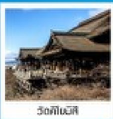
วัดโทอินจิ