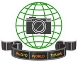
PHOTO WORLD TOURS