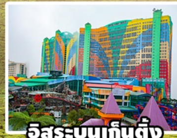
อิสระบนเก็นตัง