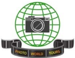
PHOTO WORLD TOURS