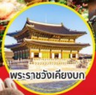
พระราชวังเคียงบก

จุดเช็คอินใหม่ สุดอลังการ!! ห้องสมุดของเกาหลี