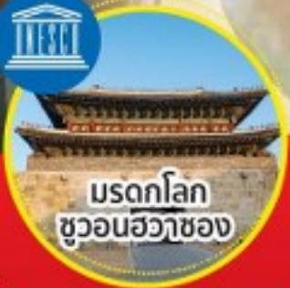
มรดกโลก ชวอนฮวาซอง