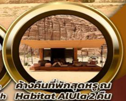
ค้ำคืนที่พักสุดหรู ณ Habitat AlUla 2 คืน