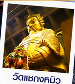
วัดเชกกงหมิว