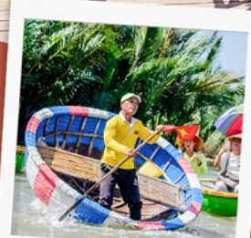
ล่องเรือกระดิง